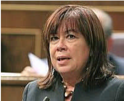
La ministra de Medio Ambiente, Cristina Narbona, anunció la aprobación de la Ley de Responsabilidad Medioambiental.

Será obligatoria, aunque no antes de 2011, una garantía financiera para las empresas con un potencial contaminante de más de 2 millones de euros.