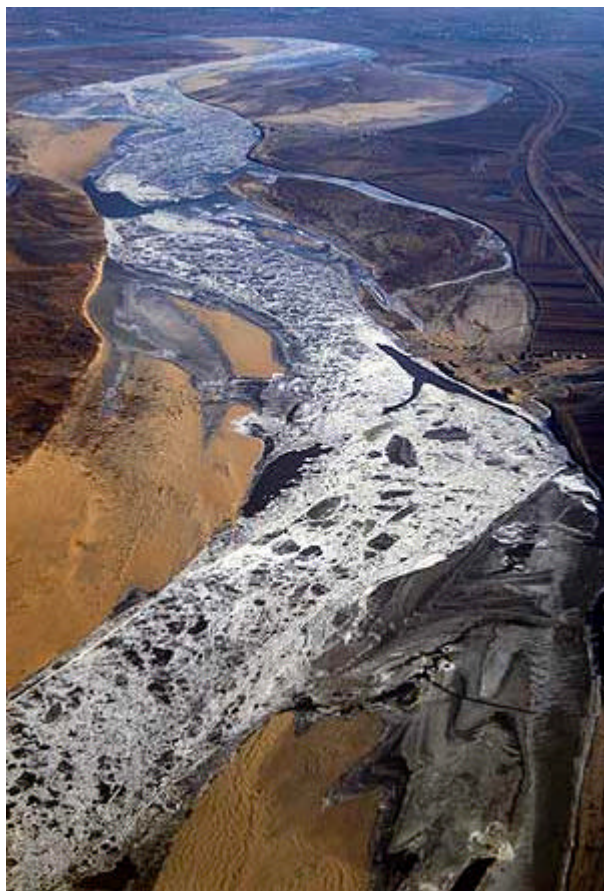
Rusia espera la llegada de la mancha de benceno

Pekín informó ayer a Moscú de los detalles del desastre, once días después de que se produjera el accidente y tras ocultar durante días a la población china las dimensiones del vertido, algo habitual en el gigante asiático debido a la censura de los medios.